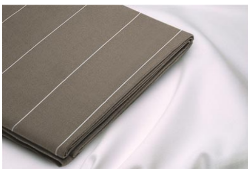
Cubremantel Rayas Paralelas