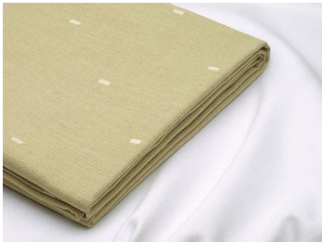
Cubremantel Volga Piedra