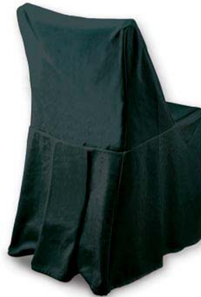
Funda silla blanca con tablón trasero, cuerda rústica, funda negra