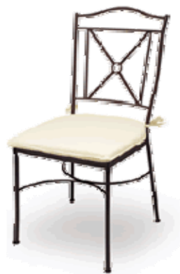
Silla hierro forjado con almohadilla color crema