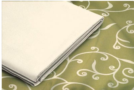
Cubremantel de hilo